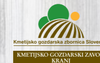
KMETIJSKO GOZDARSKI ZAVOD KRANJ